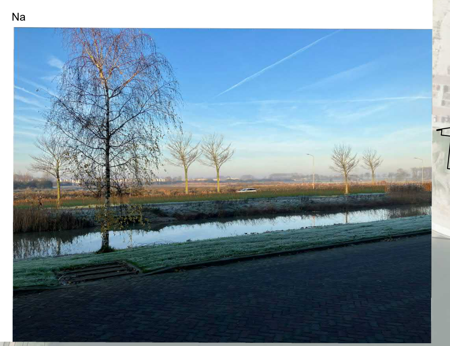
Nieuwe situatie 1:1500